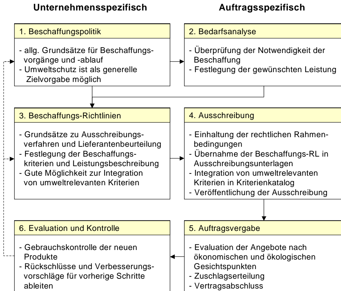
Abbildung 1: Beschaffungsablauf einer öffentlichen Ausschreibung [Berliner Energieagentur]

Der Ablauf einer spezifischen Beschaffung ist eingebettet in die Beschaffungspolitik der gesamten Institution. Dieser Zusammenhang wird in folgender Grafik für die einzelnen Schritte einer Beschaffung dargestellt.